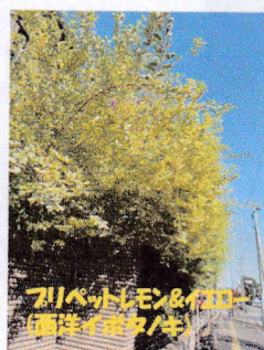
フタバトレン&はじ 両洋イモタナシ