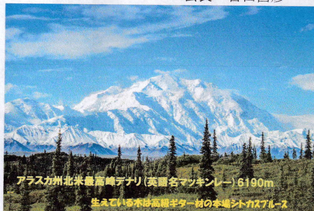
アラスカ州北米最高峰デナリ(英語名マツキンレー)6190m

山は美しく雪化粧され、冬の到来を告げる7日の大雪を過ぎると急に寒さが増す、お歳暮や年賀状、クリスマスの準備など、忙しくも賑やかで楽しい季節、大掃除やお正月の用意も忘れずに。庭先の山茶花の花や空高く背伸びしている皇帝ダリアの美しさもこの時期の風景です。コロナウイルスも下降線の報道が流れているが、信用してよいのか、疑わざるを得ない。強力な新型のオミクロンウイルスが、昨今伝えられ、心おだやかではない。年末を年始を予定されているが、まだまだ、心情は許してならない。