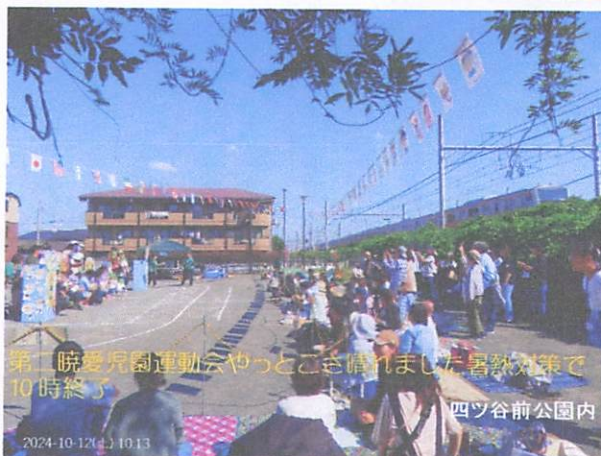
第二回愛児園運動会やっとこさ帰りました暑熱対策で10時終了 四ツ谷前公園内 2024-10-12(土) 10:13