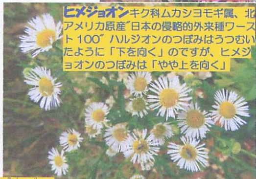
ヒメシオンキク科ムカシヨモギ属、北アメリカ原産。日本の侵略的外来種ワースト100。ハルジオンのつぼみはうつむいたように「下を向く」のですが、ヒメシオンのつぼみは「やや上を向く」