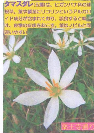
タマシダレ(玉簾)は、ヒガンバナ科の球根草。実や葉茎にリコリンというアルカロイド成分が含まれており、誤食すると嘔吐、痙攣の症状をおこす。葉はノビルと間違しやすい

漢字は、大木雄子・大塚右衛門、クワ科イチジク属の常緑性木本。茎から出る気根で区別しながら木や岩に這い登る。オオイタビの名は、イタビカスラに似て大木であることによる。