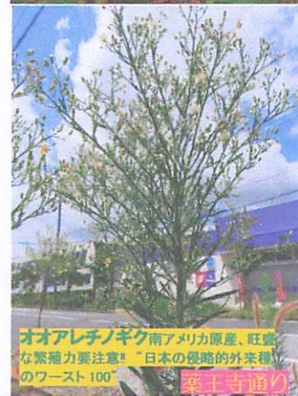
オオアレチノギク南アメリカ原産、旺盛な繁殖力要注意!! 日本侵略的外来種のワースト100