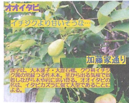
オオイタビ イチジクより甘いそうなん...

思い当たる標語はありましたか。どうせなら健康で面白がって生活したほうがいいもんね。